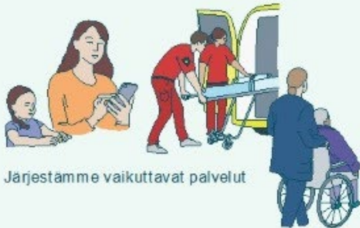
Järjestämme vaikuttavat palvelut