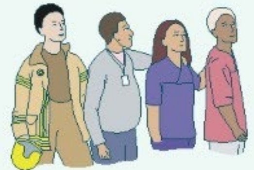
Onnistumme toisimme luottaen